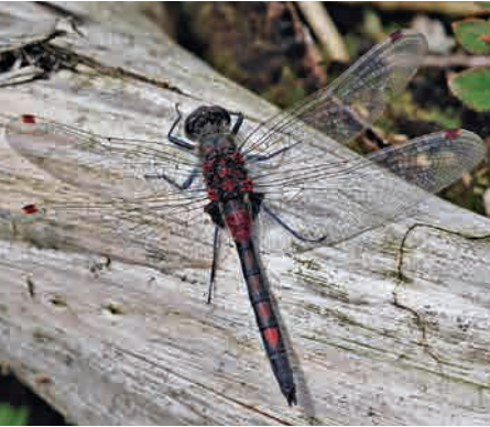
Leucorrhinia rubicunda , älteres Männchen. Die Flecken auf S2–S6 haben sich verdüstert.