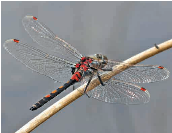
Leucorrhinia rubicunda , junges Männchen.

Larven im letzten Stadium etwas größer als die von L. dubia , Exuvienlänge 20–22 mm. Seitendornen an S8 und S9 vorhanden, Rückendornen sehr klein oder fehlend. Exuvie dunkler als die von L. dubia und oberseits einfarbig