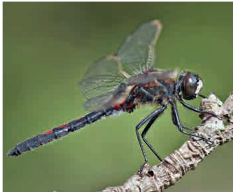
Leucorrhinia rubicunda , älteres Männchen. Deutlich erkennbar ist der sekundäre Kopulationsapparat mit dem artspezifischen, hakenförmig gekrümmten Hamulus und dem großen runden Genitallobus.